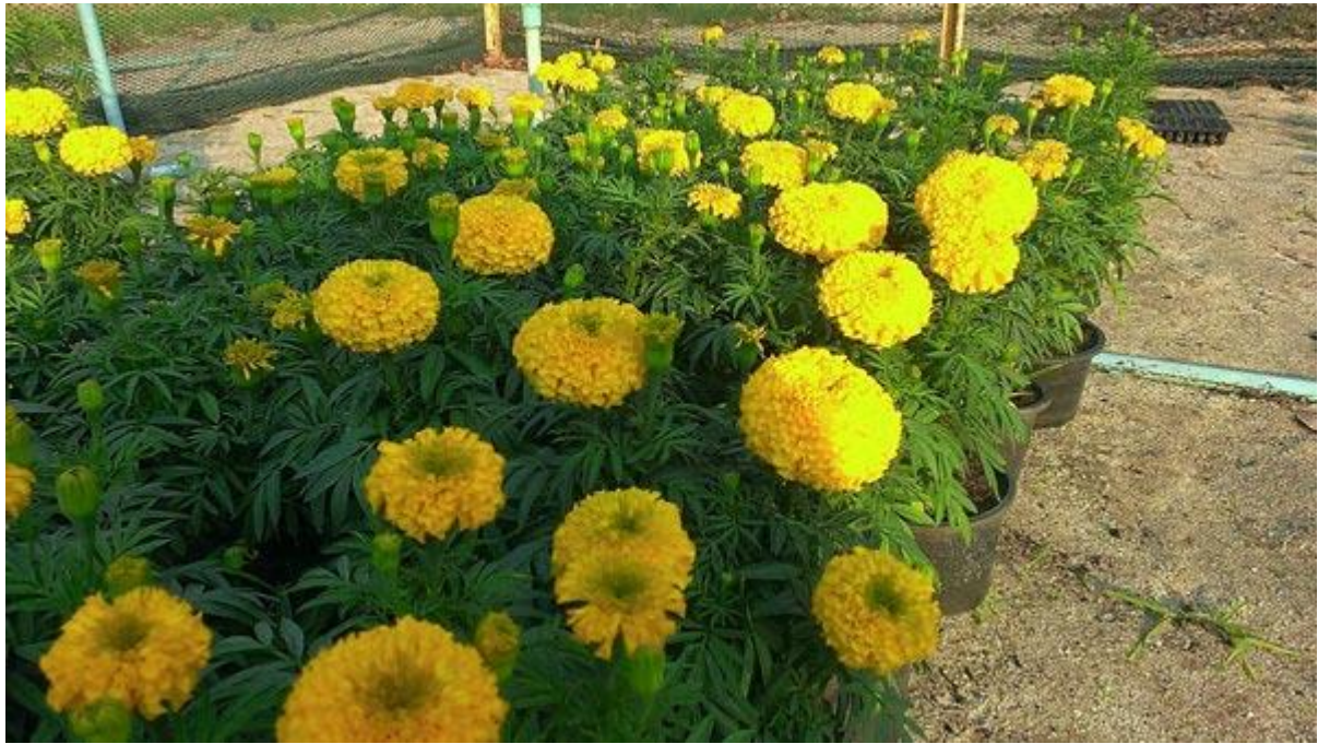
- ดอกมาแล้วด้วย