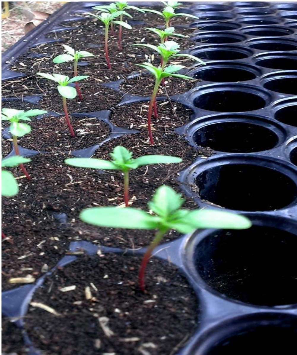
- เริ่มลุยเลยเพาะก่อน 20 เมล็ด งอกมา 18 ต้น ตีใจมากต้นน้อยน่ารัก เริ่มงอกแล้ว