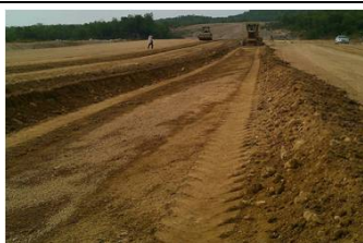
ดินถมบดอัดแน่นตัวเขื่อน กม.1+250 ถึง 1+500