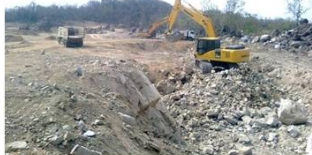
งานขุดระเบิดหินตัวเขื่อน