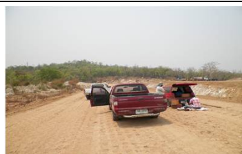
งานทดสอบดินถมบดอัดแน่นเขื่อนปิดช่องเขาต่ำ กม.0+400