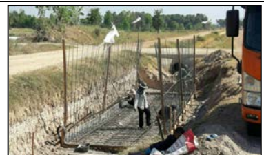
ท่อลอดถนนชนิดท่อเหลี่ยม กม.4+625 (RMC)