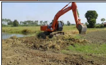
งานขุดเปิดหน้าดินคลองส่งน้ำสาย 1L-RMC