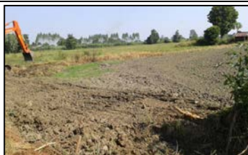
งานขุดเปิดหน้าดินคลองส่งน้ำสาย 1L-RMC