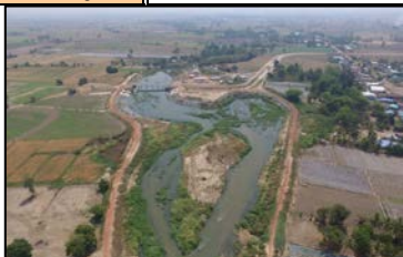
ด้านเหนืออาคารท่อน้ำฝายบ้านตลิ่งสูง