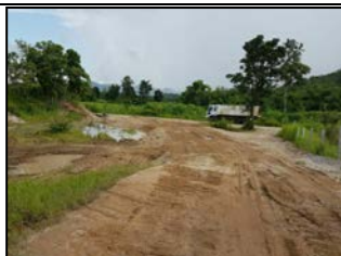
ปรับปรุงทางลำเลียง