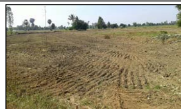
งานขุดเปิดหน้าดินคลองส่งน้ำสาย 1L-RMC