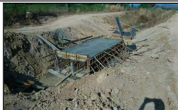
ทางระบายน้ำฉุกเฉินพร้อมท่อลอดถนน กม.1+165 (1R-RMC)