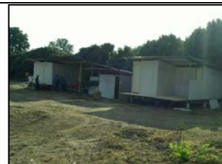
ก่อสร้างบ้านพักคนงานชั่วคราว