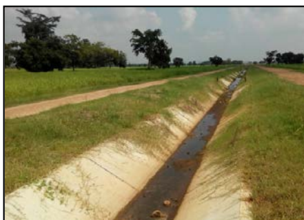
คลองส่งน้ำสาย RMC