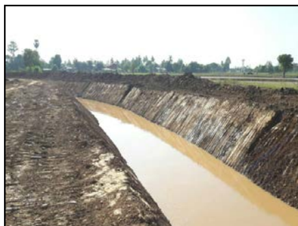
กิจกรรมงานขุดคลอง