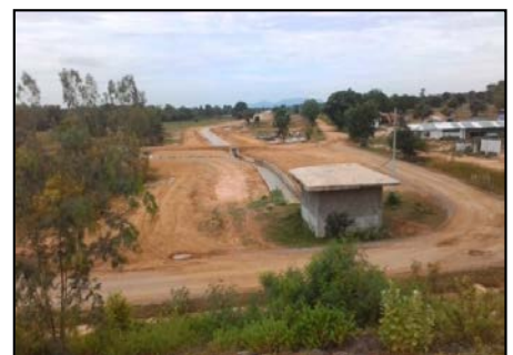
งานรำนน้ำด้านท้ายอาคารควบคุมการระบาย