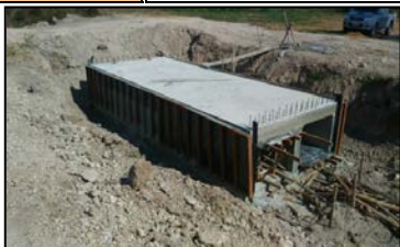
อาคารทางระบายฉุกเฉินพร้อมท่อลอดถนน กม.0+200 (1R-RMC)