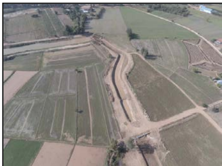
กิจกรรมงานขุดคลอง