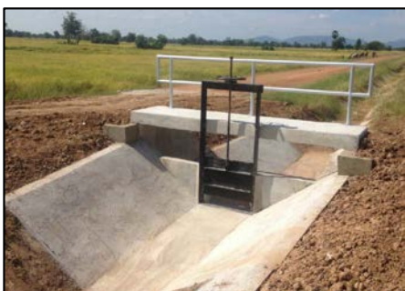
คลองส่งน้ำสาย RMC กม. 2+300 - กม. 2+500