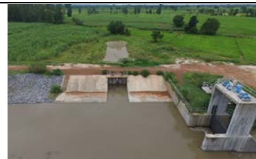
จุดเริ่มต้นคลองส่งน้ำสาย LMC