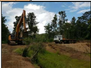
งานถางป่า