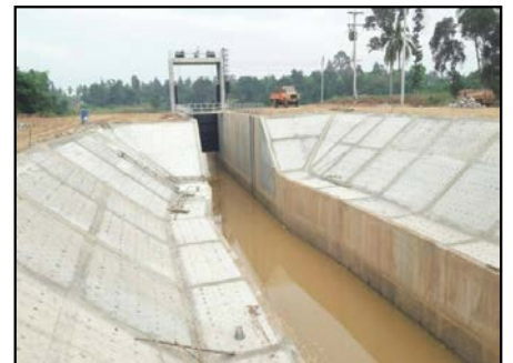
กิจกรรมก่อสร้าง ประตูคลองชักน้ำแม่น้ำน่าน-คลองอ้ายคก