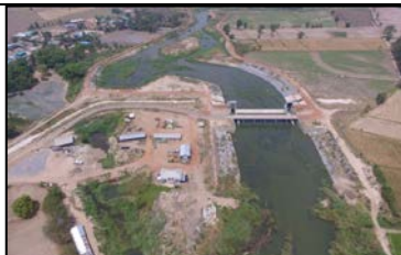
จุดเริ่มต้นคลองส่งน้ำสาย LMC