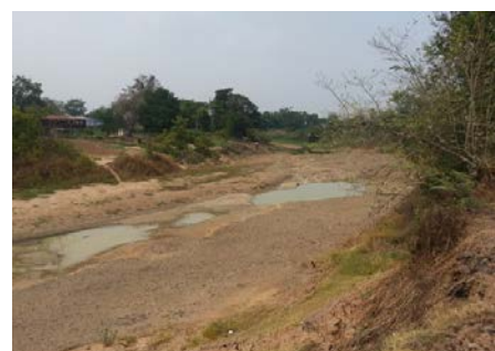
สภาพแม่น้ำยม