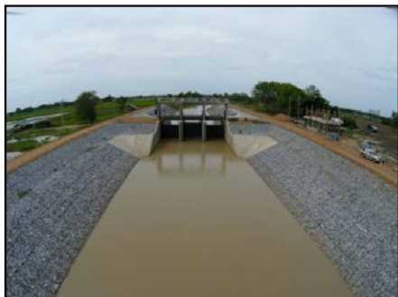
กิจกรรมก่อสร้าง ประตูทุ่งป่ากระถิน