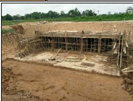
กิจกรรมท่อลอด กม.5+232