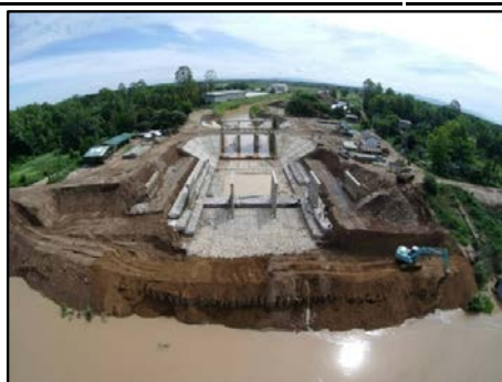
กิจกรรมประตูระบายน้ำ กม.5+731.50