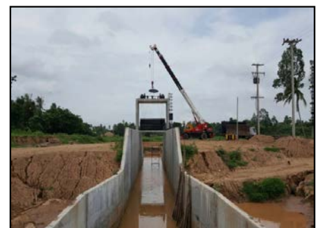
กิจกรรมก่อสร้าง ประตูคลองชักน้ำแม่น้ำน่าน-คลองอ้ายคก