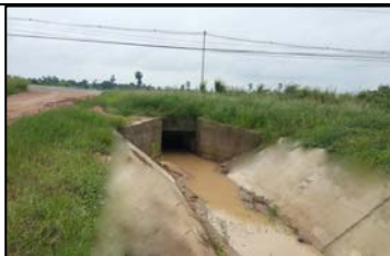
งานท่อลอดทางหลวง กม. 0+722