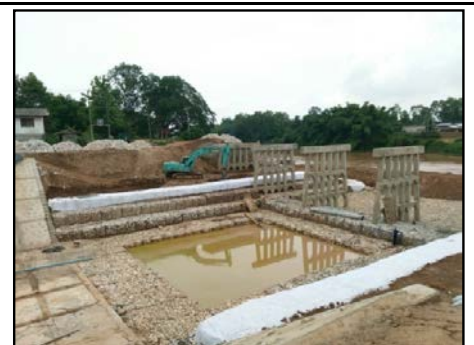
กิจกรรมสะพานรถยนต์ กม.5+793