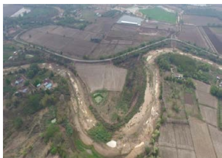
บริเวณจุดก่อสร้าง ใน Cut Off