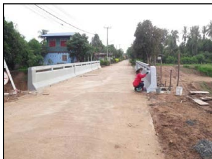
กิจกรรมก่อสร้างสะพานรถยนต์ กม.0+290