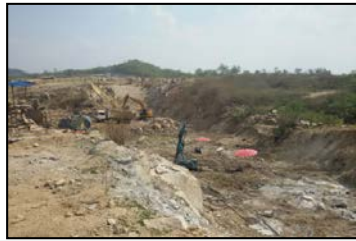
งานปรับปรุงฐานรากบริเวณร่องแชนเขื่อนหลัก