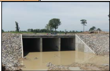
งานอาคารที่ลอดคลองส่งน้ำ กม. 6+221