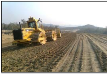
งานถมดินฐานราก