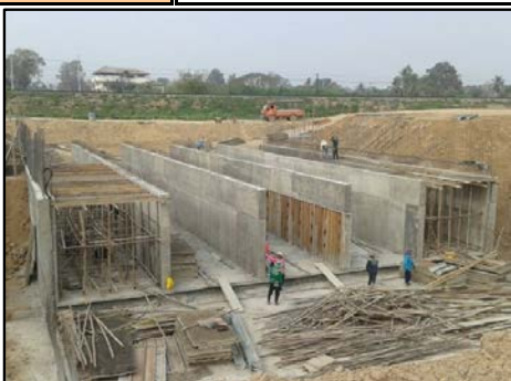
กิจกรรมท่อลอด กม.5+232