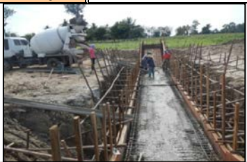
งานท่อลอดคลองส่งน้ำสาย RMC กม.1+460