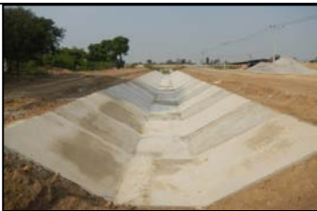
งานลาดคอนกรีตคลองส่งน้ำสาย RMC