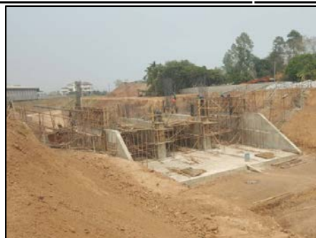
กิจกรรมประตูปรับน้ำ กม.5+731.50