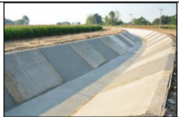
งานลาดคอนกรีตคลองส่งน้ำสาย RMC