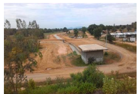
งานรณงน้ำด้านท้ายอาคารควบคุมการระบาย