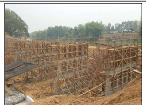
กิจกรรมสะพานรถยนต์ กม.5+793