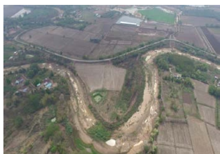
บริเวณจุดก่อสร้าง ใน Cut Off