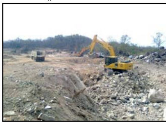
งานขุดระเบิดดินตัวเขื่อน