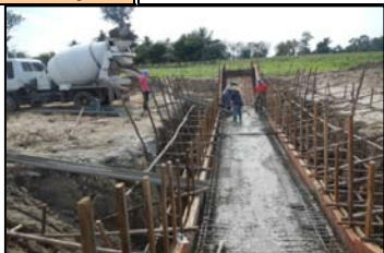
งานท่อลอดคลองส่งน้ำสาย RMC กม.1+460