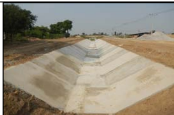
งานลาดคอนกรีตคลองส่งน้ำสาย RMC