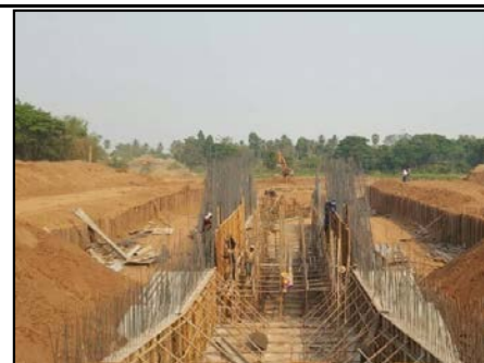
กิจกรรมก่อสร้างประตูระบายน้ำ