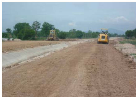
คลองส่งน้ำสาย RMC