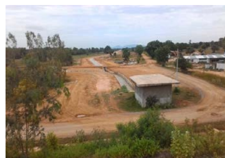
งานรื้อถอนอาคารควบคุมการระบาย