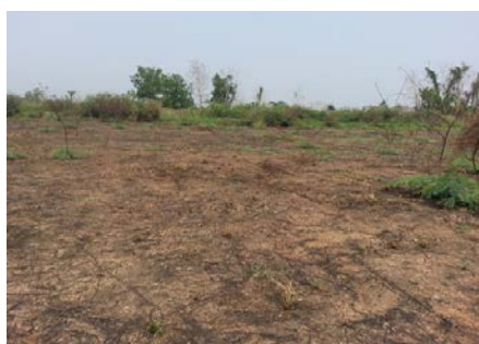
บริเวณจุดก่อสร้าง ใน Cut Off