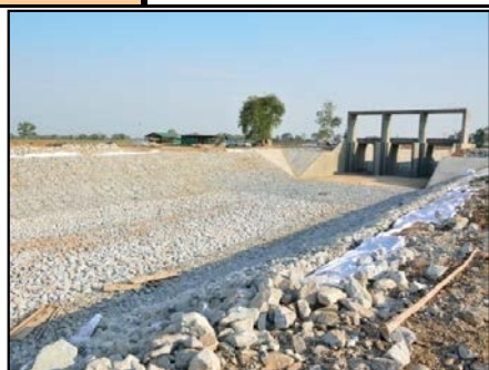
กิจกรรมก่อสร้าง ประตูทุ่งป่ากระถิน