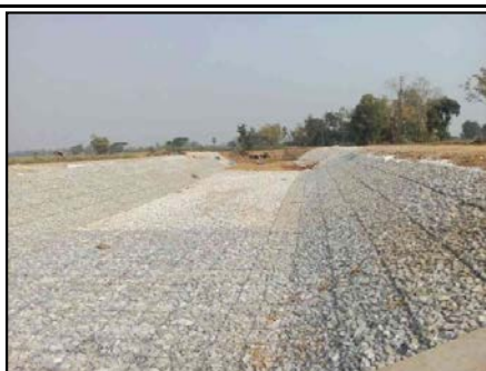
กิจกรรมก่อสร้าง ประตูทุ่งป่ากระถิน