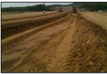
ดินถมบดอัดแน่นตัวเขื่อน กม.1+250 ถึง 1+500