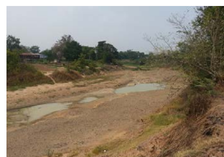
สภาพแม่น้ำยม