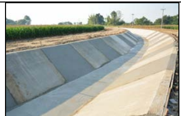
งานลาดคอนกรีตคลองส่งน้ำสาย RMC