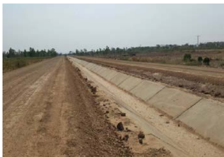
คลองส่งน้ำสาย RMC กม. 2+300 - กม. 2+500