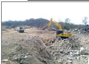
งานขุดระเบิดดินตัวเขื่อน