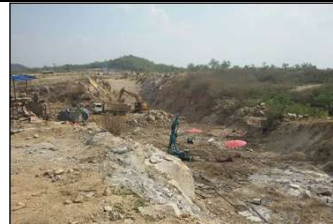
งานปรับปรุงฐานรากบริเวณร่องแกนเขื่อนหลัก