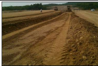
ดินถมบดอัดแน่นตัวเขื่อน กม.1+250 ถึง 1+500