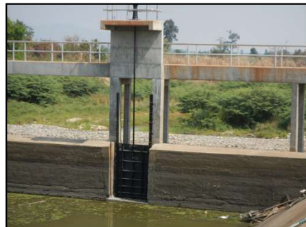
งานติดตั้งเครื่องกั้นบานระบายน้ำ