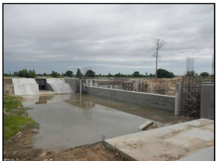
งานก่อสร้างอาคารทดน้ำ