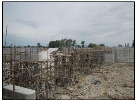
งานก่อสร้างอาคารทดน้ำ