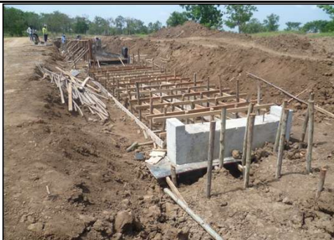
งานสะพานน้ำ กม.2+300 ถึง กม. 2+400