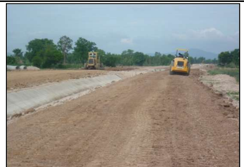
งานบดอัดแน่นถนนลูกรังบนคันคลองสาย