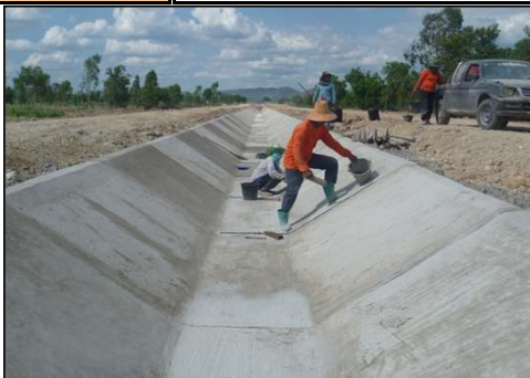
คลองส่งน้ำสาย กม. 2+300 - กม. 2+500