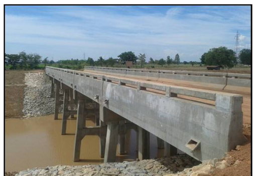
งานขุดลอกคลอง กม.0+050 - 5+204